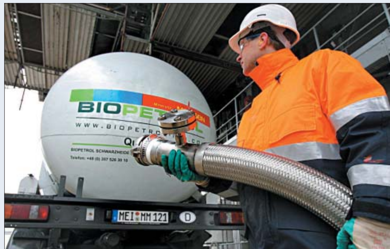
Ein Arbeiter füllt einen Tankwagen im Depot einer Biodieselfabrik der Biopetrol Industries in Rostock, Deutschland. Die Anlage wurde 2006 eröffnet. Der Konzern mit Hauptsitz in Zug besitzt zwei weitere Standorte im nördlichen Nachbarland, ein Betrieb in Rotterdam ist geplant. Biodiesel wird beispielsweise aus Pflanzenöl hergestellt, auch Altspeiseöl wird verwendet.